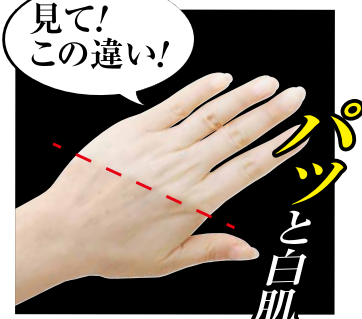
※メイクアップ効果

流して、次に驚くのが肌のサラサラ感。そして何より驚くのが鏡を見てパツと明るくなつてます。「えっ! 照明変えたっけ?」と思うくらい驚きでした。そして、この「しろかね薬用美白パック」は続けていくほどに、肌が整い明るさに磨きがかかるように感じます。本当に塗るたびにシミが消えた! と思うほどです。最近では、自分に自信が持てたのか、外に出る趣味からは美容も趣味も頑張ってます。人生を楽しみたいです。