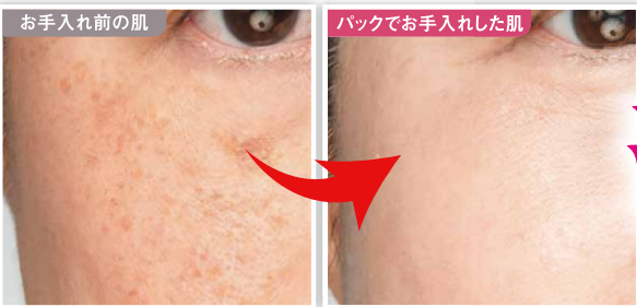
※メイクアップ効果