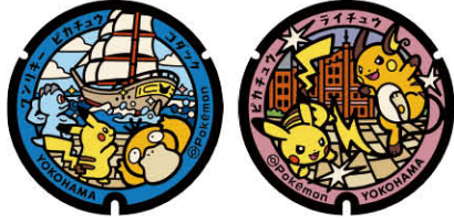
左から日本丸メモリアルパーク、横浜赤レンガ倉庫のポケふた。 ポケモンと地域の魅力が素敵にデザインされている

また、ポケモンスポットを絡めて市内を 周遊できる「横浜ポケモンスポット観光 マップ」(日英併記)も注目だ。新たに市内 4カ所に設置予定の「ポケふた」こと、ポケ モンがデザインされたマンホールのふた