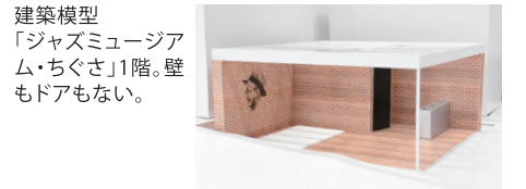
建築模型 「ジャズミュージアム・ちぐさ」1階。壁もドアもない。

現在、「ジャズミュージアム・ちぐさ」の設計を野毛商店街の方々と進めています。野毛にあったジャズ喫茶「ちぐさ」は今から90年前の創業、後に日本を代表する有名なミュージシャンとなった人々も通い詰めた店で、横浜の財産です。第二次大戦中に米軍が兵士に配布したという貴重なレコード「Vディスク」もありました。僕はジャズの知識なんてないんだけど、「ちぐさ」には大学生のころ格好つけて行きました。店ではお客が静