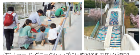
(左) カラーリングワークショップには約70名もの住民が参加 (右)カラフルな色彩で目を引く百段階段

最近では、美しが丘で生まれ育った人が子育てをしたいと戻ってくるそうです。「住んでいる人がまちをつくる」という先輩たちの想いは着実に受け継がれ、さらに魅力的なまちに進化中です。