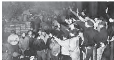
① 昭和30年代のせり風景、「横浜市中央卸売市場三十年史」から