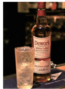
デュワーズ・ハイボール (700円税込)

お酒はバーボンを中心に200種類ほど。水割りやハイボールには、グラスの形に合わせて丁寧に削った氷を入れる。「見た目