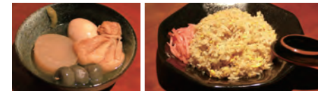
おでん (700円税込) ハイボールに合わせて

この時期におすすめなのはおでん。洋酒に合うよう濃いめの出汁で作り、柚子胡椒をつけて提供する。これからやってくる寒い夜に、美味しいお酒と温かいおでんで、疲れた一日を癒やしたい。