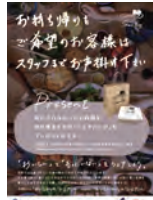
店内に掲示されるPOP(左)シェアバッグは持ち帰り用ボックスと紙袋がセットに(右)持ち帰りは自己責任で

その結果を踏まえ、今回の第2弾は、神奈川県、西区、中区の約130軒の飲食店に各300セットのシェアバッグを用意し、平成31年4月30日まで規模を拡大して行う。料理を持ち帰ることへの心理的ハードルを下げ、店内には持ち帰りOKのPOPを掲示