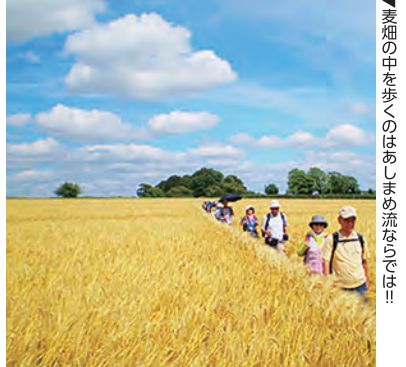
▲麦畑の中を歩くのはあしまめ流な旅!!

旅行企画・実施 ㈱日本旅行 藤沢支店 観光庁長官登録旅行業第2号 問合せ・資料請求 ☎0466(22)7411