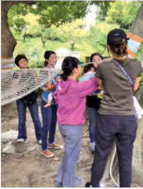
ハンモックの張り方をみんなで学ぶ

地域活動の担い手となることも少なくありません。いわばプレイパークは地域の人たちが利用し、かつ支えながら出会い、交流する子育ての拠点、まちづくり活動の入り口となっているのです。そして忘れてはならないのが子ども達の存在。様々な年齢層の子ども達が互いに関わり合いながら、遊び場の楽しさを生み出しています。