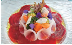
今までのベジタリアンメニューの常識を覆す見た目にも美しいメニュー

ヨコハマ グランド インターコンチネンタル ホテルでは、ベジタリアンメニューを強化。訪日外国人の約30%がベジタリアンと言われる中、新たな取り組みとして業界に先駆けて、館内全レストラン(中・仏・伊・ブッフェ)および宴会メニューで提供する。野菜や大豆のみとは思えない"美味しく美しい"メニューは、健康志向・ヘルシー志向の方にもおすすめです。