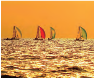
豊かな自然の中でゆったりとした休日

京急線の発駅~新逗子駅までの往復乗車券と京急バスフリー乗車券+選べる逗子・葉山ごはん券+選べるおみやげ券が付いて2,800円(横浜発・大人の場合)の「葉山女子旅きっぷ」が売れている。また、きっぷの提示で葉山マリナーのクルージングも3,240円→2,160円に!初夏の逗子・葉山をおトクに楽しもう! ※きっぷは性別問わず購入可。