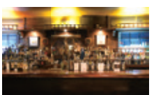
船をモチーフにした重厚で落ち着いた店内