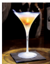
ウイスキーの芳醇な香りが嬉しい。ロブ・ロイ1,200円

学生の頃にバーでアルバイトをしたときから、いつかはやってみたいと思っていたバー。脱サラをして休業後、日本のバー発祥の地で開店。「当時の若く独身のお客様が、結婚して子どもができるとしばらく遠のかれるんですが、その子が二十歳になると『バーデビューさせてください』と言って、連れて来られるんです」と顔をほころばせる。