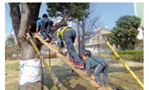
思いっきり遊べるよう、地域のボランティアと行政が協働。泥遊びやロープクライム、落ち葉プール、焚き火など、遊びはさまざま。

虫捕り、木登り、土すべり、缶けり、草野球…。かつて子どもたちは、近所の空き地や路地、小川や雑木林で自由にのびのびと遊びながら育っていました。環境の変化の中で今、子どもたちはかつてのように遊びづらくなりましたが、五感に刺激を受けながら創造力や冒険心を発揮して遊ぶことは、いつの時代でも大切なことです。 プレイパーク(冒険遊び場)は極力禁止事項をなくした自由な遊び場です。定期的に地域の公園を利用し、有志の市民の皆さんがプレイリーダーと一緒に自由な遊びを広げています。日本では70年代半ば、子どもたちの遊びに違和感を抱いていたご夫婦がヨーロッパで冒険遊び場を訪ねたことを発端に、世田谷に第1号が誕生。その後、全国に広がっていきました。 横浜では1990年代にプレイパークの取