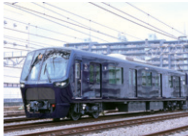
安全・安心・豊かさを、先進的なデザインに反映

創立100周年・相鉄グループの新型車両が、1月に公開された。横浜を象徴する「ヨコハマネイビーブルー」一色のシャープで美しい車体と、全車両ベニーカー・車いす用スペースを設置するなど安全と快適さを追求する仕様となっている。なお、相鉄・JR直通線開業に向け、新設される駅の名称が地域住民との協議により「羽沢横浜国大」駅に決定した。 ◆問合せ ☎045 (319) 2111 相鉄お客様センター