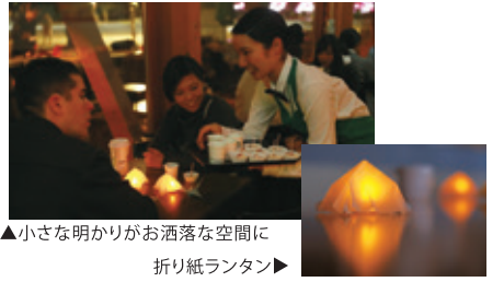
▲小さな明かりがお洒落な空間に 折り紙ランタン▶

「温暖化対策のポスターを見て『電気を消そう』と思わない方たちにも楽しく節電のメッセージを伝えたいと9つの自治体で話し合ってきました。公募によって選定されたスターバックスさんと一緒に取り組むことで、『明かりのないzeitakuな時間』という環境問題やエコに興味のない方でも楽しめるイベントになりました。自治体だけでは決