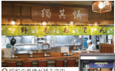
昭和の風情が残る店内。二階座敷では宴会も