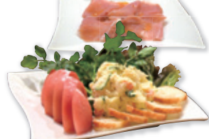
小腹が満たせるバケット付きのポテトサラダは800円。生ハム1,200円はカクテルのお供にぴったり