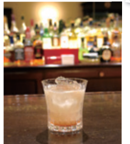
ヨコハマvol2はウオッカベース、1,200円

眺める横浜港。クーン、キング、ジャックの三塔にホテルニューグランドを望む風景はまさに横浜トワイライト。「僕の色はマリブルーでも中華街の赤でもないんだ。夕もやに霞む港ヨコハマの色」。それをカクテルにしたのがオリジナルカクテル、ヨコハマvol2。味わってみよう。