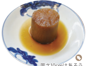
厚さ10cmはある大根500円