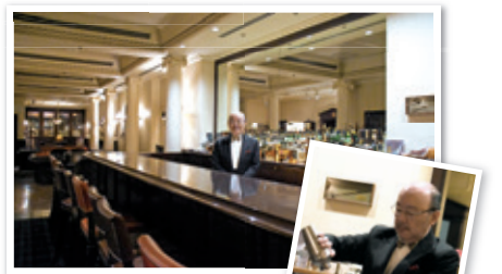
バーテンダー歴、半世紀を迎える幅さんは気さくな人柄