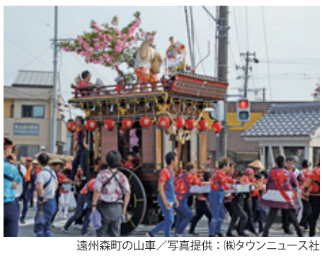
遠州森町の山車