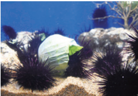
200匹のウニが、3日でキャベツ3玉を完食した

カジメなどの海藻が減り、海の砂漠化が進む現象「磯焼け」の原因であるムラサキウニを養殖し、食用化を目指す実験が三浦市の県水産技術センターと京急油壺マリンパーク、横須賀市の県立海洋科学高校の共同で行われることになった。6月28日、同センターの成果が京急油壺マリンパークにて公開された。