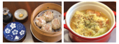
自家製焼売500円。セイロでビールの苦みを生かした鶏肉とキャベツのビール煮700円

◆中区伊勢佐木町1-7-9 イセフビル1F ◆12時~翌1時(L.O.24時30分、9月からは平日16時~) 火休 ◆☎045(315)2532