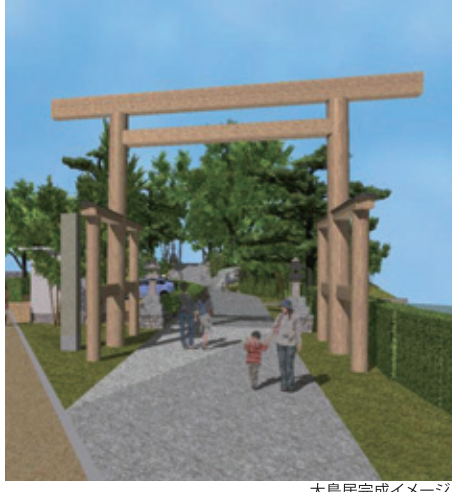
大鳥居完成イメージ