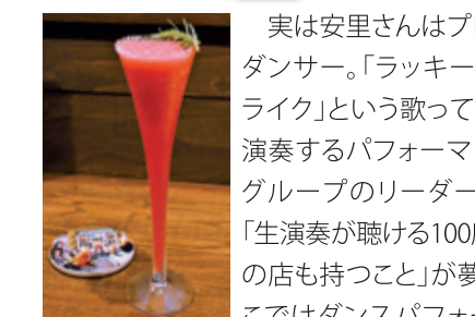
見た目も味もピカイチ、スイカのカクテル1,000円