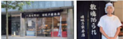
⑤ 現在の南吉田町にある本店 ⑥ 4代目・伸行さん

横浜で一番古いあられの店、敷嶋阿られ嵯峨乃家本店の創業は明治35年。初代・小野田安次郎は京都嵯峨の旅館をたたみ、東京は本郷に同店を創業した。あられとは、もち米を原料とする関西発祥の米菓。うるち米を原料とするせんべいに慣れた東京人への商売は思うようには行かず、店を横浜は福富町(現・伊勢佐木町)に移した。近くにあった野沢屋百貨店(松坂屋の前身)に初めて菓子部が新設されたのを契機に2代目の良司があられを売り込むと、それが開運となり商勢が急ピッチで伸展。戦後は、福富町周辺が連合軍に接收されたため、現在のお三の宮日枝神社近くに店を移して再