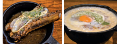
ベルギーのビール、シメイで煮込んでから焼くスペアリア800円～1,200円 ラム肉の焼くドライカレー1,200円。「ランチに出してと言われるほど人気」