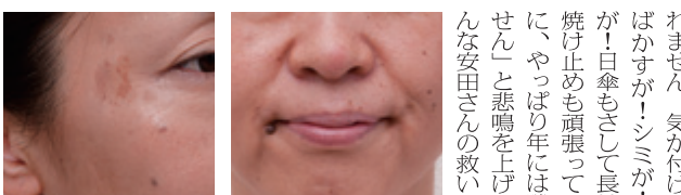
目元や頬にポツポツといつの間にか現れるシミ、乾燥による細かい小ジワ、ハリのない口元。歳を重ねれば誰しもが悩む肌の不調は、化粧品をただ塗るだけで満足いく結果を得るのは難しい。