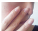
と... わお、シワも毛穴も瞬で隠れる! こんなつるん肌は何年ぶりだろう。しかも肌がトーン明るくなってファンデも薄塗りOK! 憧れの素肌っぽいメイクだわ。その手間約30秒。化粧下地だけで! これはすごい! ご機嫌で出かけた私。だが驚きはそれだけではなかった。

の新感覚。肌に伸ばすと、スーッと薄い膜になる感じ。そして塗った部分がサラサラする。これは期待できるかも! ファンデの前に、ほんの少しの量を肌の気になる部分に伸ばせばいいとのこと。とりあえず小鼻と額のシワ、それから目元にも塗ってみる