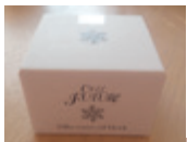
フワフワの新感覚!

後日ついに手元に、開けてみると... なんだこの軽〜いテクスチャーは。クリームでもなくジェルでもないフワフワ