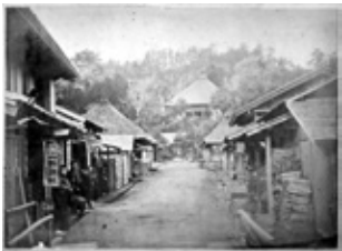
明治20年ごろの長谷観音参道

◆~5月14日(日)9時~16時30分(受付~16時) ◆観音ミュージアム ◆大人(中学生以上)300円、小人(小学生)150円(別途長谷寺入山料大人300円、小人100円) ◆問合せ ☎0467(22)6100