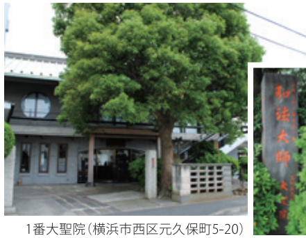
1番大聖院(横浜市西区元久保町5-20)

霊場の名称や札所の分布からは、市域の中心部を対象として設定されたものと思われるが、市域の中心部である「関外」と「関