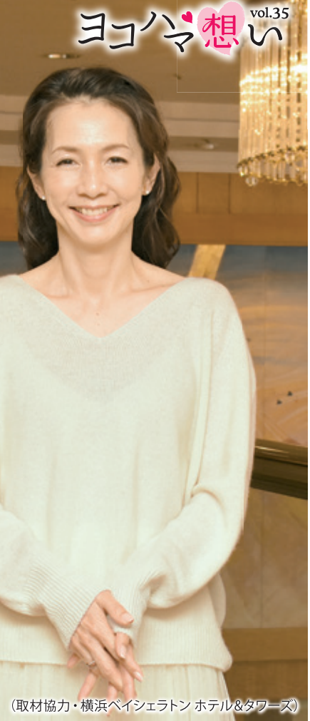
(取材協力・横浜ベイシェラトン ホテル&タワーズ)

1967年横浜市中区生まれ。横浜雙葉小中高を経て、国際基督教大学卒業後、1990年TBSに入社。アナウンサーとして様々な番組を担当し、1998年フリーに。「ニュースステーション」終了まで担当し、現在はバラエティ番組やコラム掲載など、幅広く活躍中。写真家山下寅彦さんのネコ写真に渡辺さんが詩文を添えたポストカードカレンダー「低血圧なネコ」を毎年発売、好評を博している。