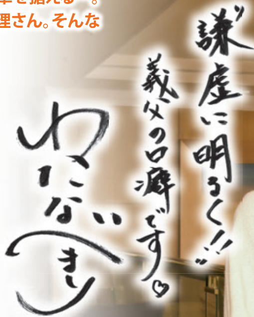
アナウンサー 渡辺 真理さん

テレビやラジオを通して「情報」というパッケージを預かり、見てくださっている方に届けるという仕事の難しさは常に感じます。伝