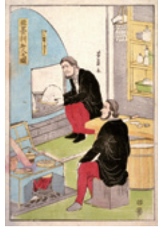
パン焼きの様子が描かれている「聖墨利加人之図」(1861年・横浜開港資料館蔵)

だんごのようなパンを外国人に助言を求めながら改良を重ねたという。「富田屋」は、戦後は「カガベーカーリー」と改称し営業が続いたが、1965年におしくも廃業。