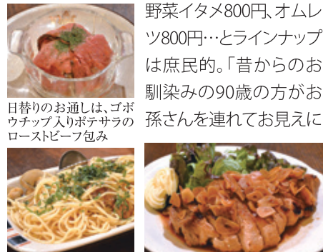
ポリュームのあるボンゴレビアンコ1,000円 豚のロース350gのポークステーキ1,000円、にんにくもたっぷり

なったり、初めておいでになる若い方には、普段どんなものを飲んでいるか聞いて、好みに合うウイスキーをすすめたり。まあ、居酒屋だと思って気楽に来ていただけたらうれしい」と博之さん。歴史を感じさせるバーながら、家庭的な暖かさが潜んでいて何度か通いたくなるバーである。