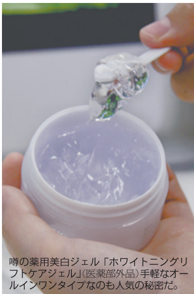
噂の薬用美白ジェル「ホワイトニングリフトケアジェル」(医薬部外品) 手軽なオールインワンタイプなも人気の秘密だ。