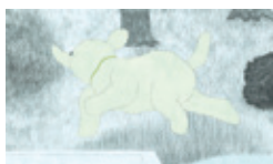
《私の沼》2017年、HDビデオ5面 My Marsh, 2017, 5 channel HD video

国内外の映画祭で注目を集めるアニメーション作家・和田淳氏の公立美術館での初個展。一枚一枚手で描かれるやわらかでぬくもりのある線と、シニールなキャラクターが醸し出す「間」による独特の和ワールド。今回は氏が初挑戦した複数画面で構成される新作映像インスタレーションも発表される。